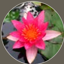
Naturteich Natural Pond

Nature is our teacher and the model for the biological water care products from Back to Nature.