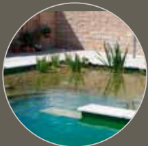
Schwimmteich Swimming Pond

Wir nutzen die Kraft der Natur für die biologische Wasserpflege. Unsere Pflegemittel basieren auf unseren langjährigen Studien in Teichen aller Art und der Erforschung natürlicher Gewässer. Das Hauptaugenmerk liegt darin ein positives Wasserklima zu schaffen und das ökologische Gleichgewicht zu fördern. Unerwünschte Algen fühlen sich in diesem Teichklima nicht wohl. In neuen Gewässern wird das Wachstum durch ein ausgeglichenes Teichklima minimiert und in Bestandsteichen verkümmern unerwünschte Algen z.B. Fadenalgen bereits nach kurzer Zeit. Grünes Wasser klärt sich innerhalb weniger Wochen.