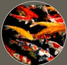
Koiteich Koi Pond